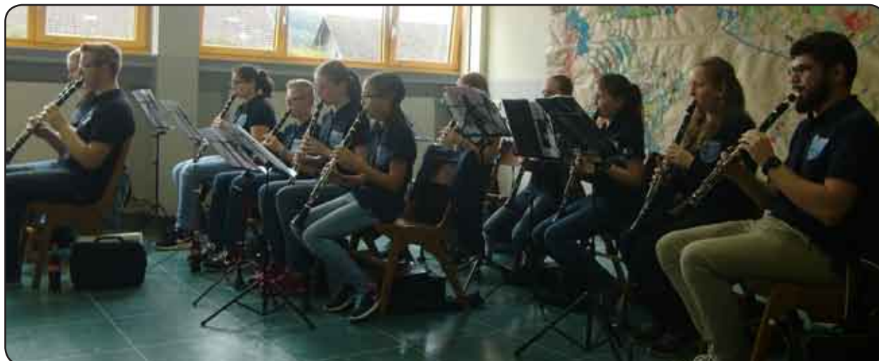
Der Klarinettensatz des Jugendorchesters beim diesjährigen Probentag.